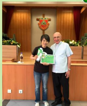
藝人何嘉麗小姐為 我們分享信仰歷程