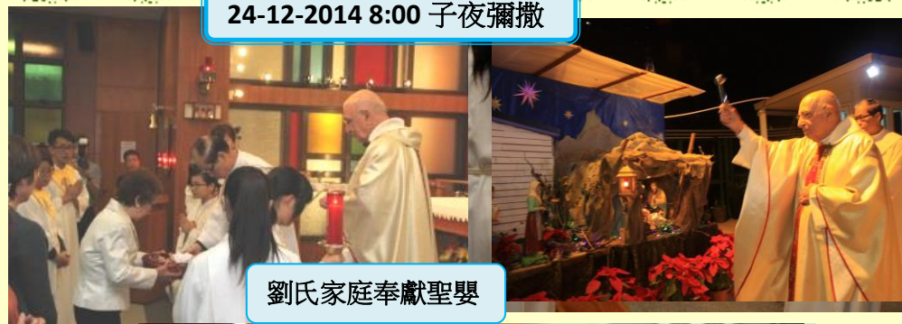
劉氏家庭奉獻聖嬰