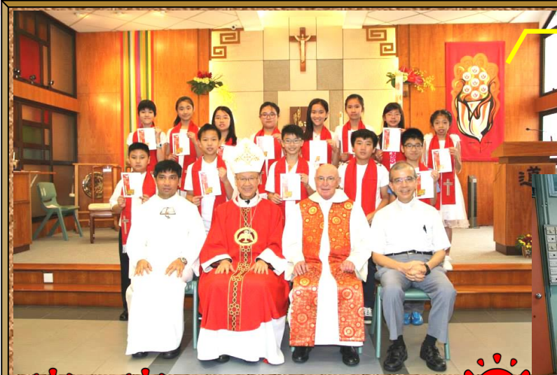
13 位主日學學生領受堅振聖事