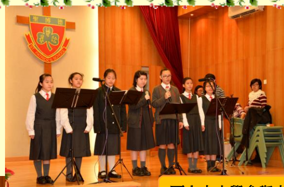
區內中小學參與表演項目