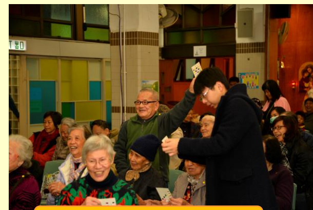
玩遊戲、抽獎，中獎最開心!!!