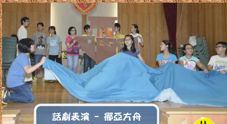
話劇表演 - 挪亞方舟 小朋友開心舞動