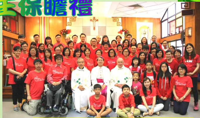
堂區四個歌詠團體聯合為主保瞻禮詠唱