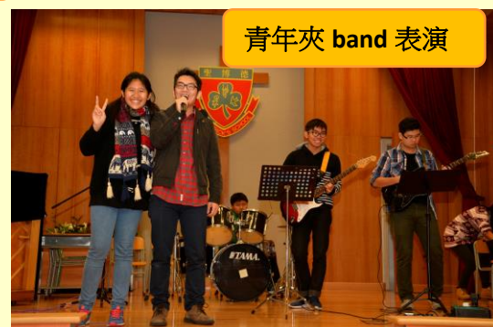
青年夾 band 表演