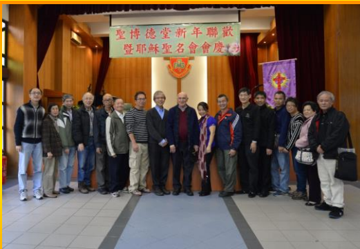
工作人員和神父合照