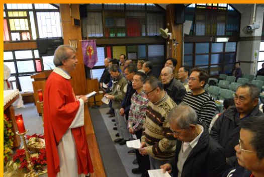
耶穌聖名會會慶及派遣禮

這個一年一度的活動，既可聯歡及增進友誼，同時也讓外教徒或無信仰者參與，接近天主，深感欣慰！今次的活動，承蒙堂區各善會義工和弟兄姐妹的無私相助，安排有序，感謝天主！