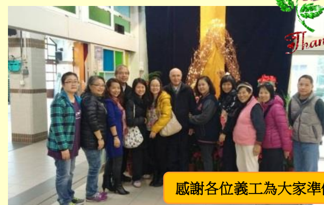
感謝各位義工為大家準備豐富的自助午餐