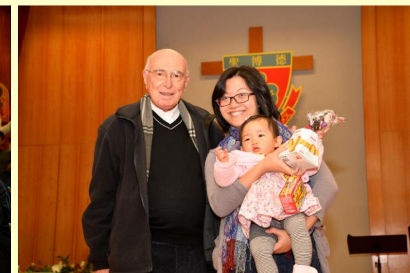
Elaine 姐姐和她的 11 個月大 B 女作分享和見證